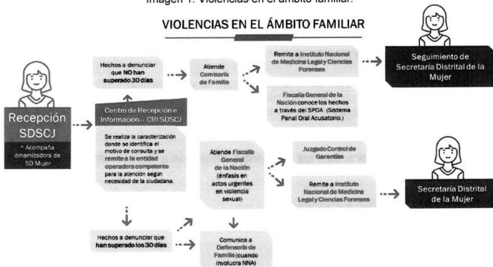
Imagen 1. Violencias en el ámbito familiar.