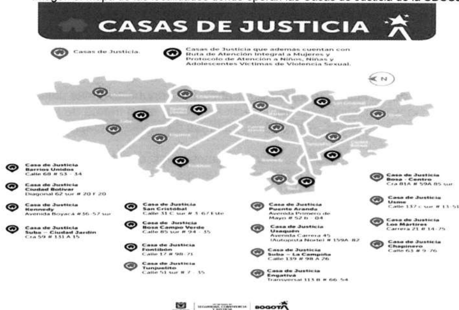
Imagen 3. Mapa de las localidades donde operan las Casas de Justicia de la SDSCJ